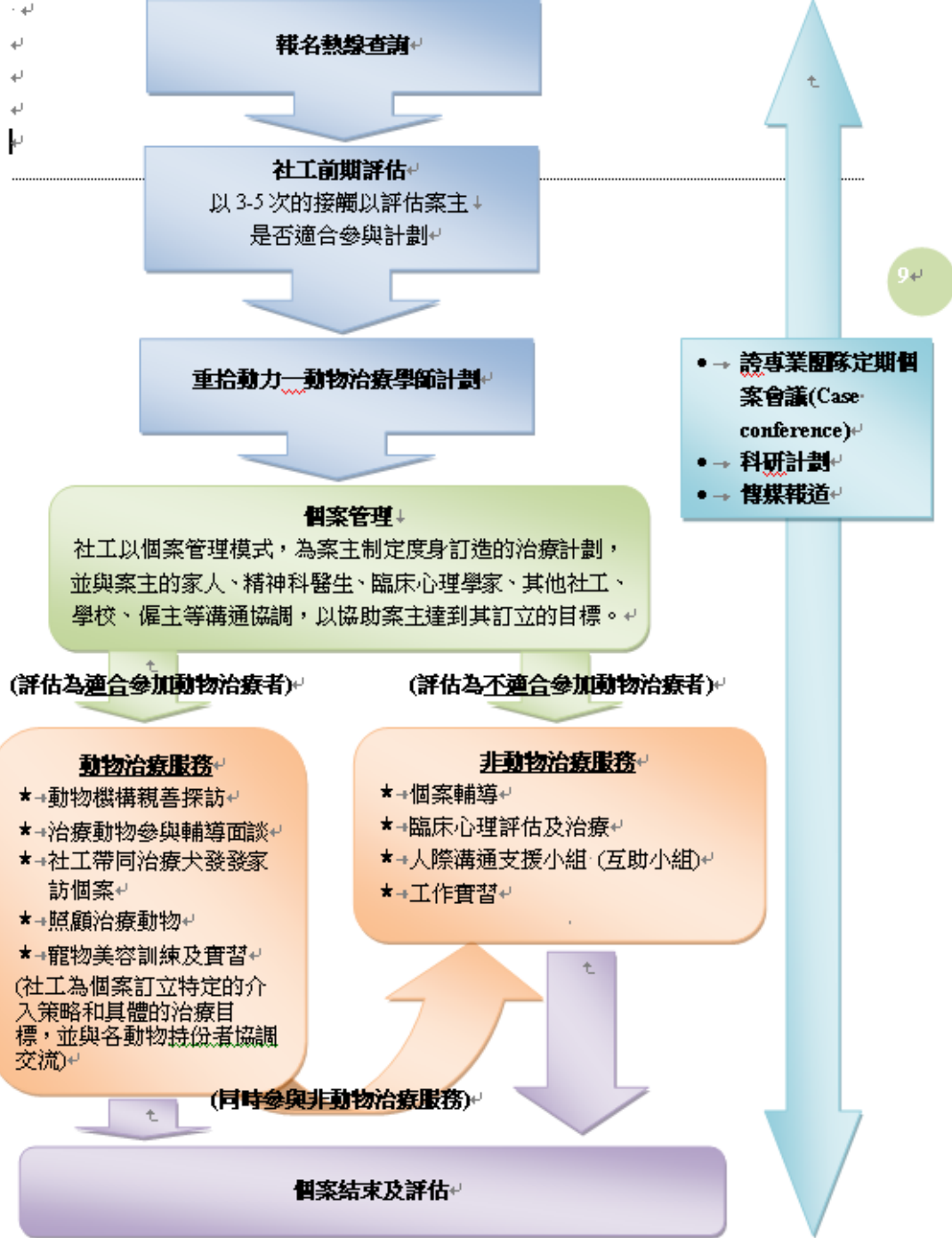
圖 4 「重拾動力」計劃服務內容流程圖